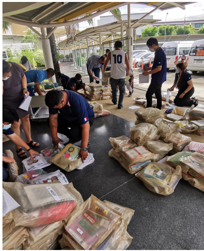
Livraison des affaires scolaires aux élèves