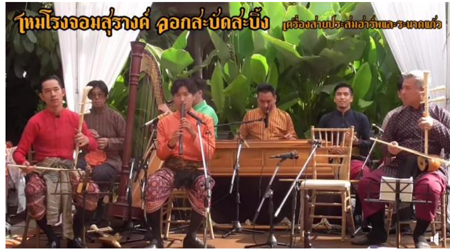
ทีมโรงจอมลู่รงค์ ลอกสะบัดสะบิ้ง เครื่องสายปรื่องสำรับและระนาดแก้ว