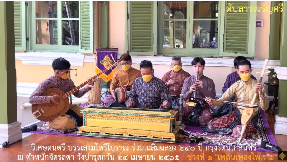
ตับลาวเจริญศรี