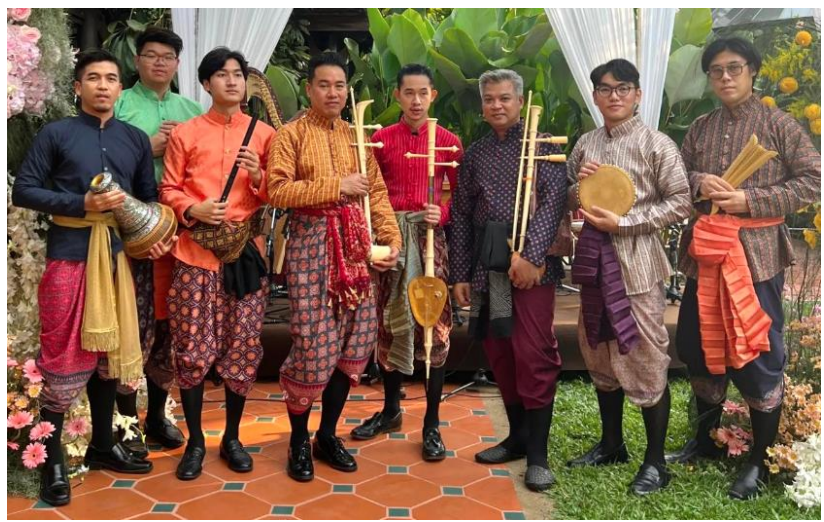
วิเศษดนตรี บรรเลงมโหรีโบราณ ร่วมเฉลิมฉลอง ๒๕๐ ปี กรุงรัตนโกสินทร์ ณ ตำหนักจิตรลดารโหฐาน วันพุธที่ ๒๔ เมษายน ๒๕๖๕ ช่วงที่ ๑ "เพลินเพลงไพเราะ"