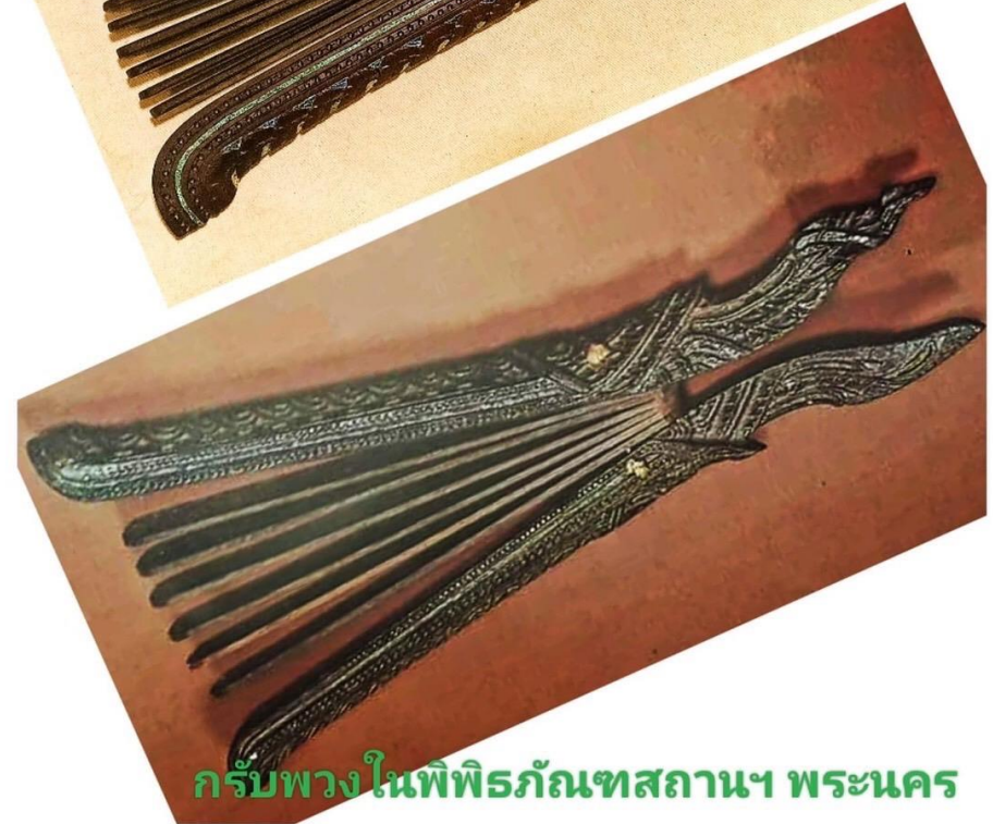
กรับพวงในพิพิธภัณฑ์สถานฯ พระนคร