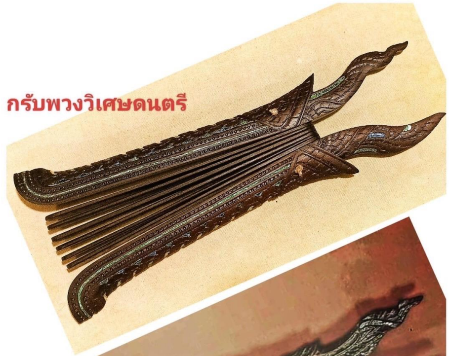
กรับพวงวิเศษดนตรี

Le deuxième instrument que nous avons découvert s'appelle « Krap puang » (กรับพวง) et ressemble curieusement à un éventail de bois. C'est un instrument de percussion facile à manier, il donne du rythme et accompagne le « Ching » ou la cymballette de doigts (ฉิ่ง). Comme son nom l'indique, nous entendons le son Grab - Grab qui nous semble très en harmonie avec les sons Ching et Chab.