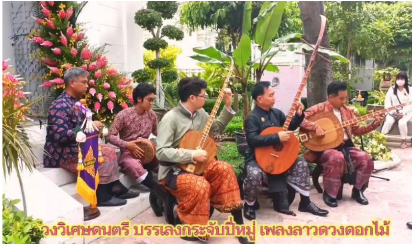
วงวิเศษดนตรี บรรเลงกระจำปีหมู เพลงลาวดวงดอกไม้