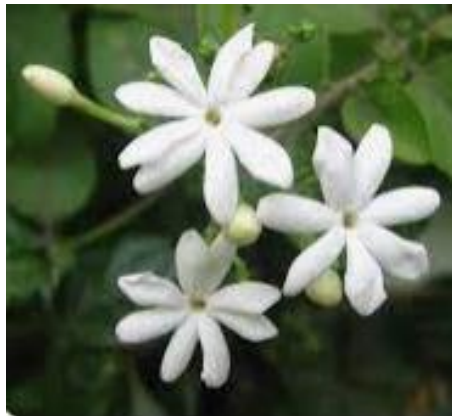
พุทธรชาด