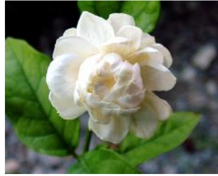
มะลิซ้อน