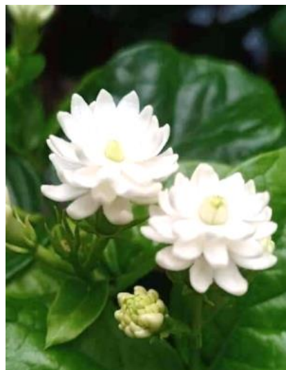
มะลิพิกุล หรือ มะลิฉัตร หรือ มะลิถอด

Jasminum sambac (L.) Aiton 'Mali Chat Phikun'