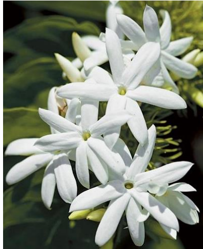
มะลู่ตี หรือมะลิพวง หรือมะลิเลื้อย