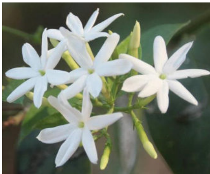
มะลิไส้ไก่