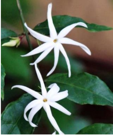
มะลิวัลย์