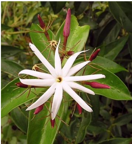
มะลิหลวง